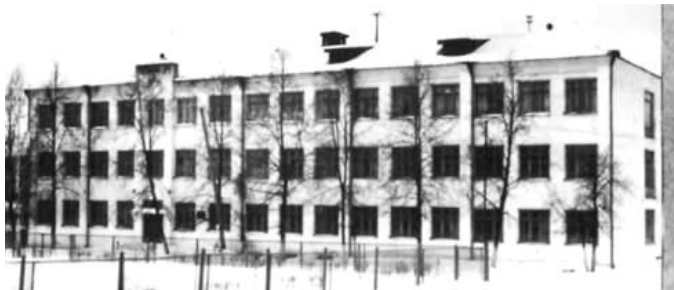
пос. Ис, 80-е годы