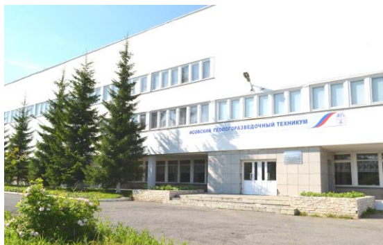
г. Нижняя Тура, 2011г.